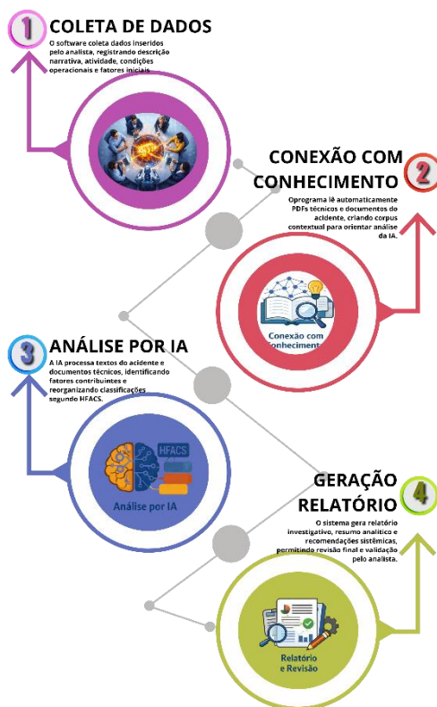
Figura 2. Funcionamento do sistema computacional de investigação de falhas e acidentes

Após a inserção dos dados do acidente, o sistema estabelece conexão com uma base de conhecimento composta por documentos técnicos e científicos previamente armazenados. Esses materiais incluem artigos, manuais e referências metodológicas associadas a abordagens sistêmicas de investigação de acidentes, como HFACS e AcciMap. O aplicativo realiza a extração automática de trechos relevantes desses documentos, formando um corpus de referência utilizado durante o processo de análise. Esse mecanismo funciona de maneira semelhante ao princípio de Retrieval-Augmented Generation (RAG), no qual conteúdos externos são incorporados ao contexto fornecido ao modelo de inteligência artificial.