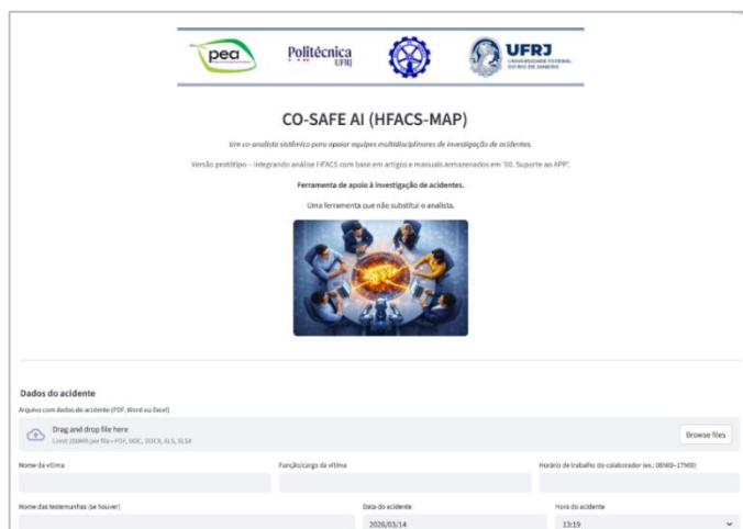
Figura 3. Interface inicial da ferramenta de investigação de falhas e acidentes

Observou-se também que o uso de Inteligência Artificial acelera a etapa inicial de análise de relatos de acidentes, especialmente em cenários com grande volume de dados textuais. Nesse contexto, o sistema atua como ferramenta de apoio à triagem e organização das informações, permitindo que os investigadores concentrem esforços na interpretação dos resultados e na elaboração de recomendações. De modo geral, a ferramenta apresenta potencial para apoiar investigações mais estruturadas e consistentes, favorecendo a identificação de fatores sistêmicos frequentemente negligenciados em abordagens tradicionais centradas em causas imediatas. Apesar dos resultados