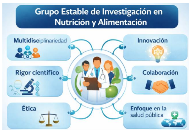
Figura 1. Características de capacidad investigadora acreditada de los miembros del grupo.

Se propone desarrollar proyectos de investigación colaborativos enmarcados en el plan estratégico nacional y en el ámbito internacional, que coadyuven en el desarrollo y promoción de la investigación en nutrición centrado en mejorar la salud pública y combatir problemas como la obesidad, la diabetes, las enfermedades cardiovasculares y la malnutrición, así como coadyuvar en la formación investigativa de profesionales de la salud en estudiantes de Licenciatura en Nutrición, Maestría y doctorado. La capacidad investigadora del grupo integra los criterios de la Figura 1.