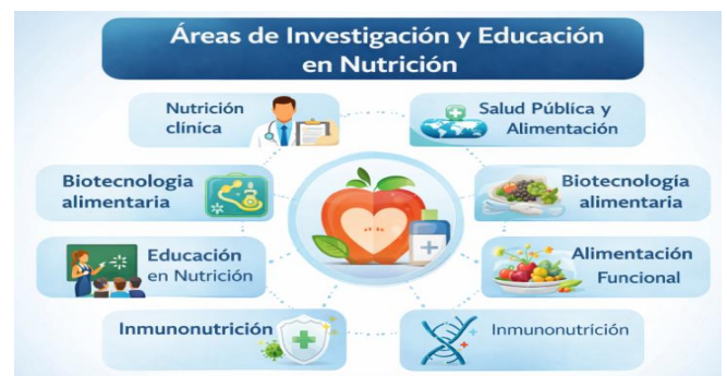
Figura 2. Líneas de Investigación del Grupo Estable de Investigación en Nutrición y Alimentación.

A lo largo de 15 años la Universidad Anáhuac México ha logrado impulsar la investigación en nutrición, desarrollando diversas líneas de investigación (Figura 2) y alta producción científica (Gráfica 1)